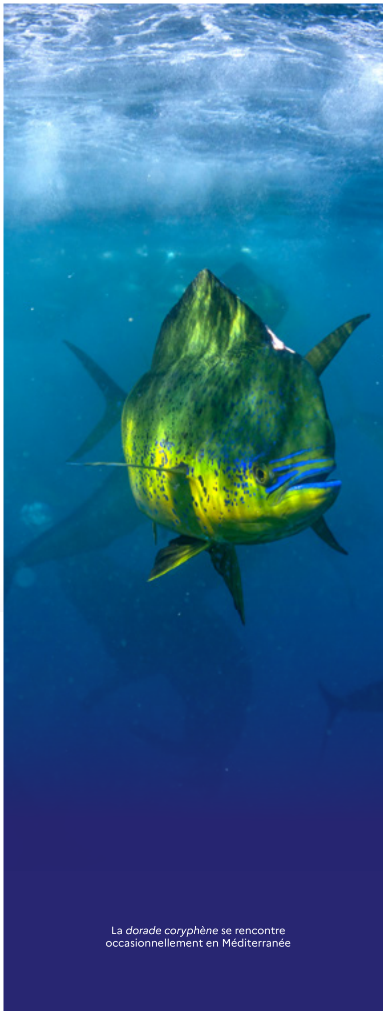
La dorade coryphène se rencontre occasionnellement en Méditerranée

Les données collectées respectent la réglementation sur la protection des données personnelles et ne seront pas utilisées à des fins commerciales. Elles sont uniquement utilisées à des fins de connaissance scientifique, conformément à l'article 55 du règlement (UE) 2023/2842 sur le contrôle des pêches.